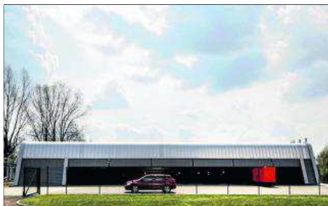
Stacja Transformatorowa ST-12, MPL Balice koło Krakowa