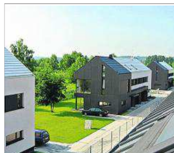
Osiedle Black & White w Krakowie