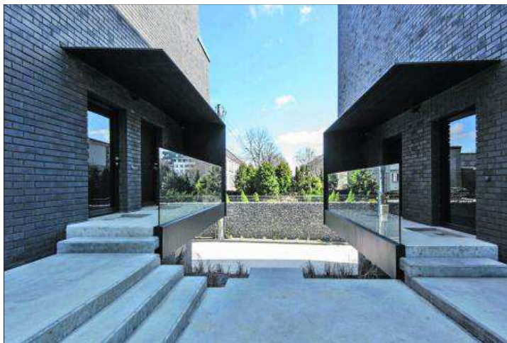
Kompleks mieszkaniowy – Apartamenty Lea 251 w krakowskich Bronowicach