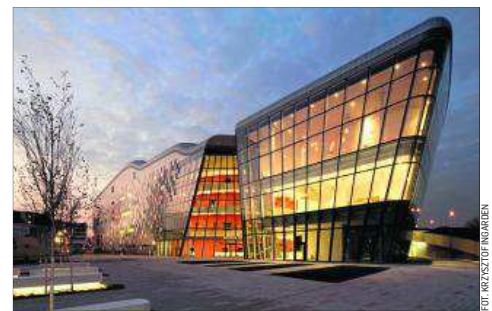
ICE Kraków Congress Centre w Krakowie