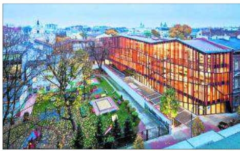
Małopolski Ogród Sztuki w Krakowie

● Osiedle Black & White w Krakowie. Architekci: Piotr Kita, Tomasz Koral (Kita Koral Architekci).