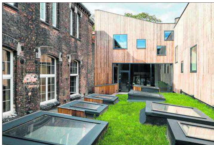
Wydział Rzeźby Akademii Sztuk Pięknych w Warszawie przy ul. Spokojnej 15

stronne tarasy z dużymi przeszkleniami, dające wgląd w otaczające tereny zielone. Do wykończenia elewacji użyto okładziny ceramicznej, która jest materiałem tradycyjnym, a zastosowana monochromatyczność barw jednocześnie nadaje budynkom nowoczesnego i minimalistycznego charakteru. (M)