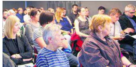
Małopolska Okręgowa Izba Architektów RP prowadzi systematyczny cykl szkoleń dla architektów