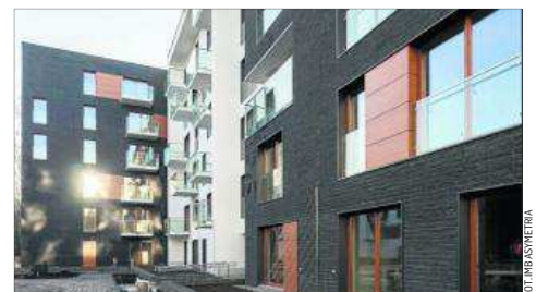
Kompleks apartamentowy – Apartamenty Novum w Krakowie