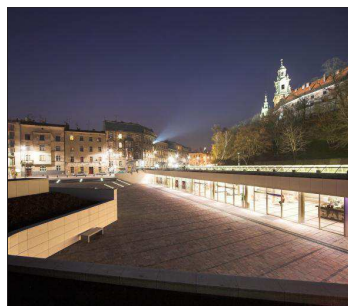
Centrum Obsługi Ruchu Turystycznego w Krakowie