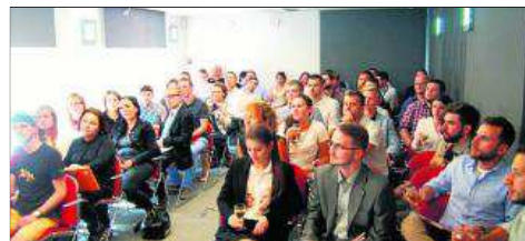
Kursy przygotowawcze, egzaminy na uprawnienia budowlane organizowane przez Małopolską Okręgową Izbę Architektów RP