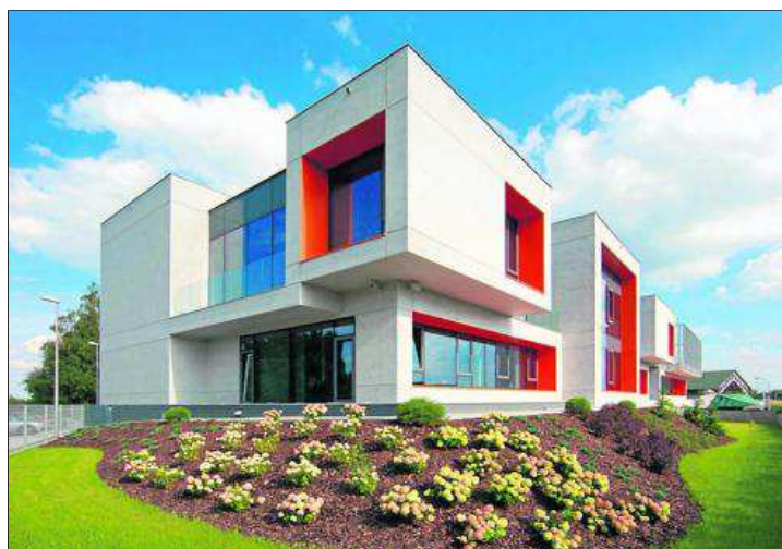
Biurovec Consultronix znajdujący się w Balicach koło Krakowa

zmiarami. Chociaż jest dość nowoczesna, stara się wpisać w kontekst urbanistyczny miejsca. Budynek ma bardzo oszczędny i skromny charakter, całkowicie pozbawiony detali architektonicznych. Projektanci starali się uzyskać kontrast pomiędzy charakterem nowej i starej zabudowy. (M)