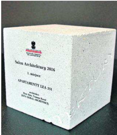
Statuetka w plebiscytcie twórców zrzeszonych w Małopolskiej Okręgowej Izbie Architektów RP

Skąd taki pomysł? Architekci zrzeszeni w Małopolskiej Okręgowej Izbie Architektów RP chcą mówić o architekturze pozytywnie. Można – oczywiście – inaczej, ale bardziej inspirujące jest ich zdaniem wskazywanie i upowszechnianie bardzo dobrych, zasługujących na uznanie rozwiązań.