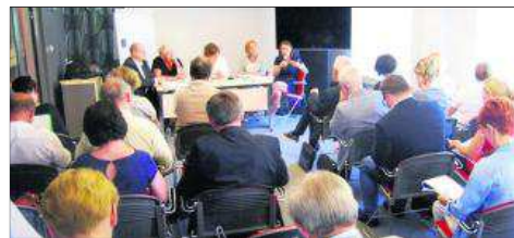
Siedziba Izby: narada z Urzędem Wojewódzkim oraz wydziałami budownictwa starostw powiatowych