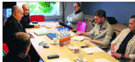
Obrady Zespołu Warunków Wykonywania Zawodu przy Małopolskiej Okręgowej Izbie Architektów RP